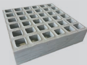
MAAS 19 X 19 HOOGTE 25