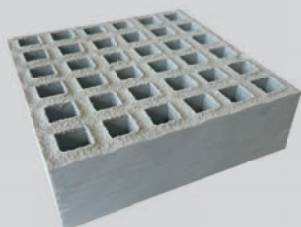
MAAS 38 X 38 OU 19 X 19 HOOGTE 38