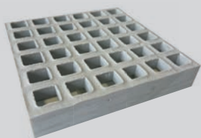
MAAS 19 X 19 HOOGTE 20