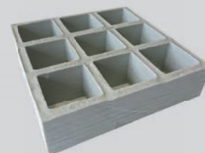
MAAS 38 X 38 OU 19 X 19 HOOGTE 30